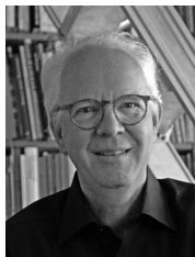
Rolf Sachsse 2. prosince 2016 11:30

Rolf Sachsse je profesionální fotograf, který studoval dějiny umění, komunikační studia a německou literaturu na univerzitách v Mnichově a Bonnu. V dizertační práci se zabýval vztahem architektury a fotografie ve dvacátém století. Působí jako kurátor, publicista a fotograf a v současnosti je vedoucím katedry dějin a teorie designu na Sárské vysoké škole výtvarných umění v Sarrbrückenu, kde zároveň zastává funkci prorektora pro akademické záležitosti. Je autorem více než 400 článků o dějinách fotografie, designu, architektury a sound artu. Bibliografie je k dispozici na www.hbksaar.de/sachsse .